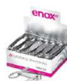
7065 942 CORTADOR DE UNHA C/ CHAV. (EM CAIXA) ENOX