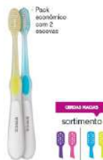
5889 2092 PACK COM 2 ESC DENTAIS KESS EXT CLEAR