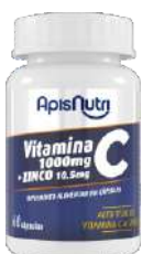
SUPLEMENTO DE VITAMINA C + ZINCO 60 CAPS