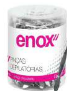
14623 941 PINÇA DEPILATÓRIA ENOX (EM POTE)