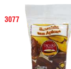
3077 - BANANADA TACHAO S/ AÇUCAR 200G CX C/25