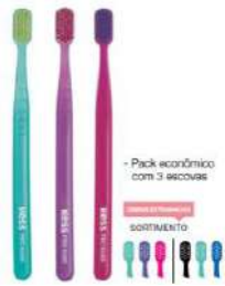
14126 2109 PACK COM 3 ESCOVAS DENTAIS KESS PRO EXTRA MACIAS