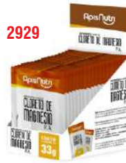
DISPLAY C. DE MAGNESIO 15UN 33G