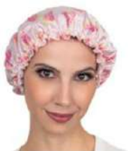
14112 3402 TOUCA DE BANHO CETIM COLORS RICCA