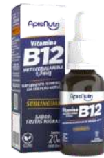
SUPL. DE VITAMINA B12 METILCOBALAMINA