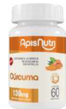
CURCUMA 130MG 30CAPS