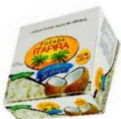
3316 - COCADA ITAPIRA S/ AÇUC DP C/30 23G CX C/12