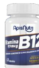
SUPLEMENTO DE VITAMINA B12 60 CAPS