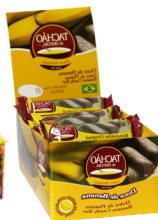
3081 - BANANADA TACHAO DP C/24 S/ AÇUCAR CX C/12