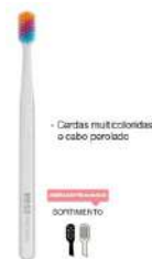
14130 2104 ESCOVA DENTAL KESS PRO COLORFUL EXTRA MACIA