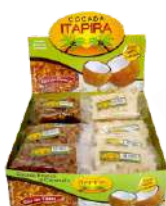
3315 - COCADA ITAPIRA MISTA DP C/30 23GR CX C/12