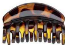
14093 867 PIRANHA RICCA CLASSICA