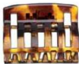
14092 865 PIRANHA MED. RETANGULAR