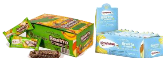
13831 - DOCE DE BANANA CREMOSA DP24X30G