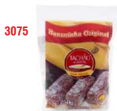
3075 - BANANADA TACHAO ORIGINAL 250G CX C/40