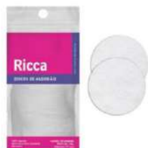
14104 3218 ALGODAO DISCO PADRAO 50 UND RICCA