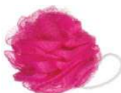
7040 301 ESPONJA PARA BANHO PEQUENA RICCA