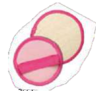
7651 311 BUCHA VEGETAL REDONDA RICCA