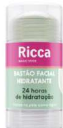
14171 3817 BASTAO FACIAL HIDRATANTE RICCA