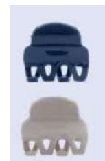
14099 2729 PIRANHA RICCA CLASSIC MINI FALL C/D