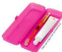
14113 3340 PORTA ESCOVA E PASTA DE DENTE RICCA