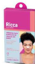
14177 3717 FITA ADESIVA PARA RETIRAR CRAVOS DO NARIZ RICCA