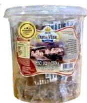
13741 - DOCE BEIJO C/9 POTES 1,050KG