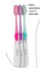
5891 2101 PACK COM 3 ESC DENTAIS KESS EXT CLEAR