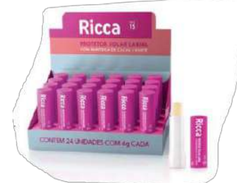
7652 2276 PROT LABIAL COM MANTEIGA DE CACAU KARIT