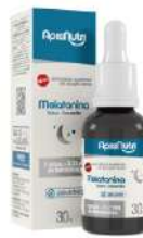
MELATONINA GOTAS 30ML CAMOMILA