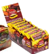
3080 - BANANADA TACHAO DP C/24 CHOCOLATE CX C/12