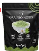
SO ORA PRO NOBIS 100G POUCH APISNUTRI