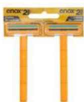
5866 1761 APARELHO DESCARTAVEL ENOX 2 PAR