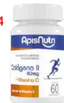
COLAG. TIPO II VITAMINA C 500MG 60 C