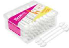
14105 3245 HASTES FLEXIVEIS BABY 60PCS RICCA