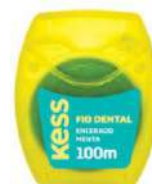
5869 2001 FIO DENTAL KESS 100M