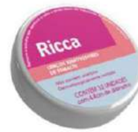
14166 3702 LENÇO REMOVEDOR DE ESMALTE RICCA 32UN