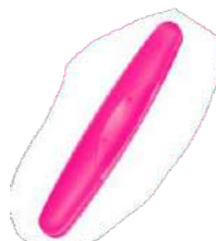
14106 3300 PORTA ESCOVA DE DENTE RICCA