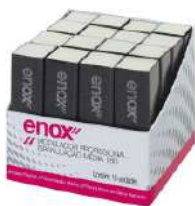
14630 2350 BLOCO MODELADOR DE UNHA GRAN. MÉDIA ENOX (DISP 16 UNID)