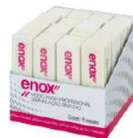
14629 2351 BLOCO MODELADOR DE UNHA GRAN. FINA ENOX (DISP 16 UNID)