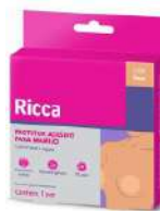
14606 3439 ADESIVO PARA PROTEÇÃO DE MAMILOS RICCA REUTILIZÁVEL BEGE