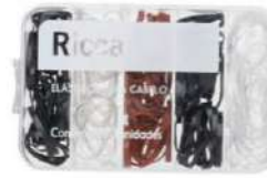
14087 3344 ELASTICOS INVISIVEIS 200 PCS COM CASE RICCA