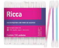
14111 3244 HASTES FLEXIVEIS 150PCS POTE RICCA