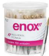
14636 1712 PINÇA INOX PONTA DIAGONAL (EM POTE)