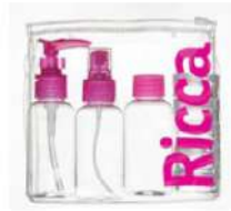
14110 3311 KIT DE VIAGEM MANDALA COLOR RICCA