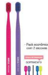
5892 2105 PACK COM 2 ESCOVAS DENTAIS KESS PR EXTRA