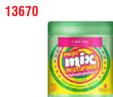
COND MAGIC MIX DEFINIÇÃO PERFEITA 500G