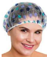
7078 392 TOUCA PARA BANHO ESTAMPADA RICCA