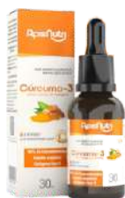
CURCUMA-3 GOTAS 30ML LARANJA E GEN