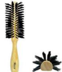
14154 415 ESC MAD RICCA NYLON MEIA LUA