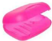
7089 3301 SABONETEIRA RICCA