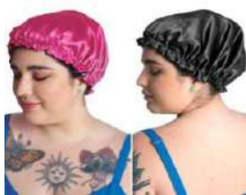
14100 3434 TOUCA DE CETIM DUPLA FACE