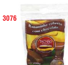
3076 - BANANADA TACHÃO C/ CHOCO 200G CX C/25