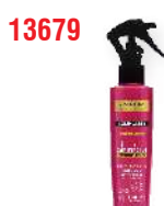
COND SPRAY ACIDIFICANTE FRIZZ OUT 135ML