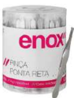
14635 1731 PINÇA PONTA RETA ENOX (POTE)