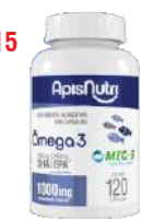
OLEO DE PEIXE OMEGA 3 120 CAPS 1