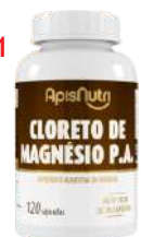
CLORETO DE MAGNESIO P.A. 600MG 120CAPS