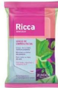
7092 3712 LENÇO DE LIMPEZA FACIAL RICCA 20PC