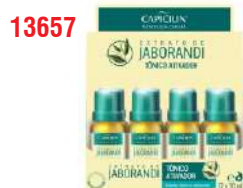
COND JABORANDI TONICO 12X20ML