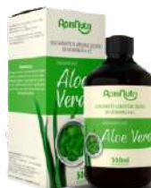
ALOE VERA 500ML