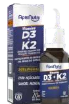
SUPL. DE VITAMINA D3 K2 MENTA - GOTAS