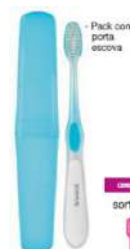
5878 2018 ESC DENTAL KESS EXTREME CLEAR PORT ESCV