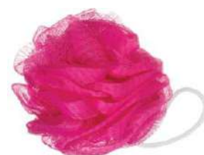
7039 300 ESPONIA PARA BANHO GRANDE RICCA