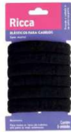
14083 2725 ELASTICO GROSSO 6 UN BLACK