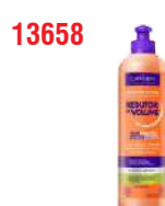
COND REDUTOR VOLUME RELAXANTE NAT 300ML