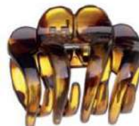
7055 863 PIRANHA MED CONCHA