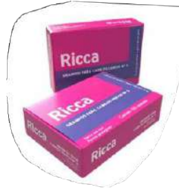
7043 3107 GRAMPO P CABELO PRETO N5 RICCA