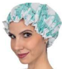
14115 3403 TOUCA DE BANHO FASHION RICCA