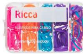
14086 3345 ELASTICOS COLORIDOS 200PCS COM CASE RICCA