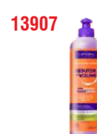
COND RED VOL MASCULINO 300ML