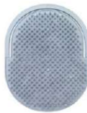
14142 358 PENTE MASCULINO OVAL