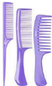
14149 1001 PENTES RICCA BASIC PACK 3