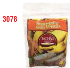
3078 - BANANADA TACHAO C/ CANELA 200G CX C/25