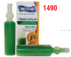
TONICO CAPILAR TRICOFORT 20ML CX C/6 UND