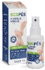
SOS PES DESODORANTE BLANT 80ML