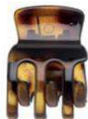
7054 861 PIRANHA PEQ LISA