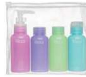
14109 3288 CONJUNTO COM 4 FRASCOS DE VIAGEM RICCA