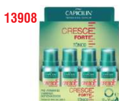
COND CRESCER FORTE TON 12X20ML