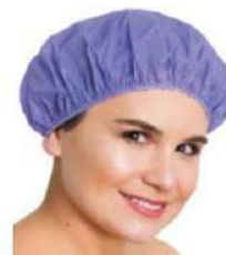
7077 391 TOUCA PARA BANHO LISA RICCA