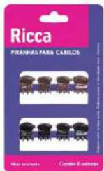
14103 1968 MINI PIRANHA RICCA C/ 8