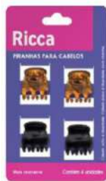
14084 853 PIRANHA CLASSIC MINI 1.5