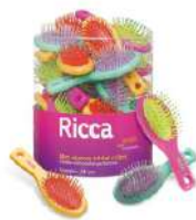
14605 489 MINI ESC RICCA CRISTAL COLORS (EM POTE)