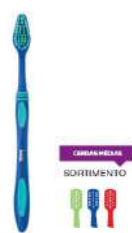
14136 2531 ESC. DENTAL KESS BASIC SUPRA MEDIA