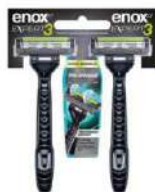
14118 1752 APARELHO DE BARBEAR 3 LAMINAS