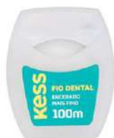
5871 2003 FIO DENTAL KESS BASIC 100M