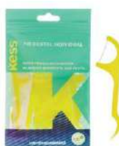
5868 1998 FIO DENTAL KESS INDIVIDUAL COM 30 UND