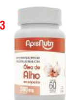
OLEO DE ALHO 60 CAPS 380MG APISNUTRI