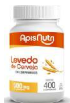
LEVEDO DE CERVEJA 400 COMPRIMIDOS