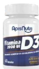
SUPLEMENTO DE VITAMINA D 280MG 60 CAPS