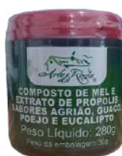
COMPOSTO DE POEJO E EUCALIPTO POTE 280G