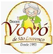
BANANADA ZERO 270G