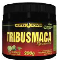
TRIBUS MAÇA 200G EFERVESCENTE