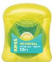
5867 1996 FIO DENTAL KESS 50 M