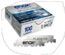
14119 1760 LAMINA BARBEAR 1/2 LAMINA ENOX PLATINUM 100