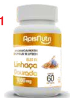
OLEO DE LINHACA 60 CAPS 1G