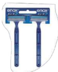
5864 1753 APARELHO DESCARTAVEL ENOX GT 2 PAR