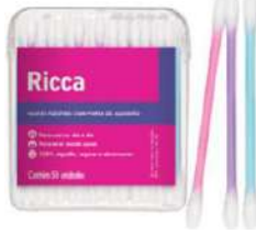
14114 3243 HASTES FLEXIVEIS 50PCS TRAVEL PACK RICCA