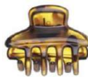
7056 864 PIRANHA RICCA MED CURVA