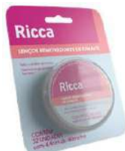
14175 3705 LENÇO UMEDECIDO REMOVEDOR DE ESMALTE COM BLISTER 32UN