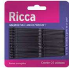
14096 342 GRAMPO P CABELO PRETO N7 RICCA