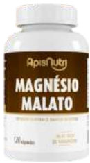
MAGNESIO MALATO 650MG 120 CAPS